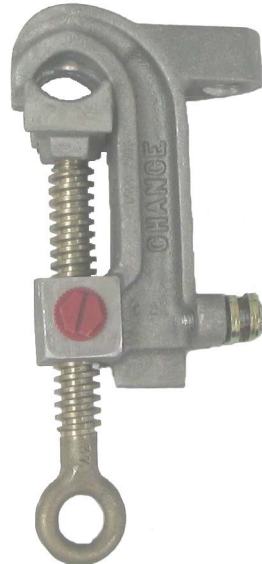
PINCE VERSATILE / VERSATILE CLAMP