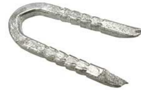
# 9802-DC # 8514-DC Tige Carré

*DC =Encoché pour anti-recule./ Deep cleated non-back out